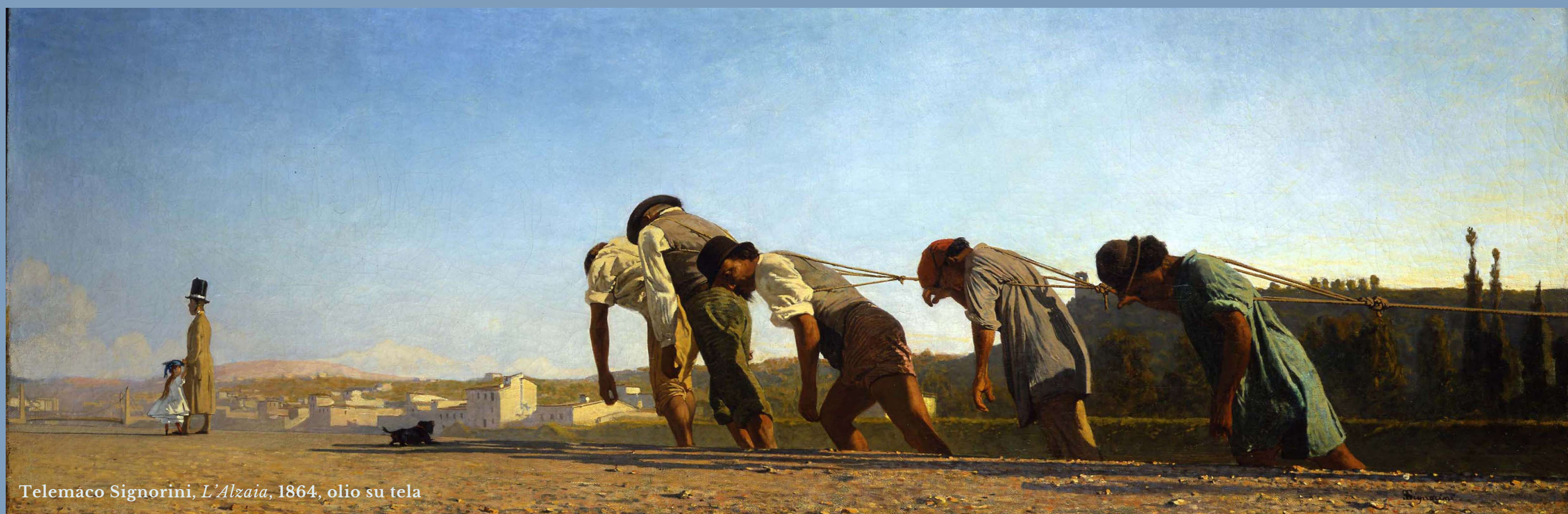
Telemaco Signorini, L'Alzaia , 1864, olio su tela